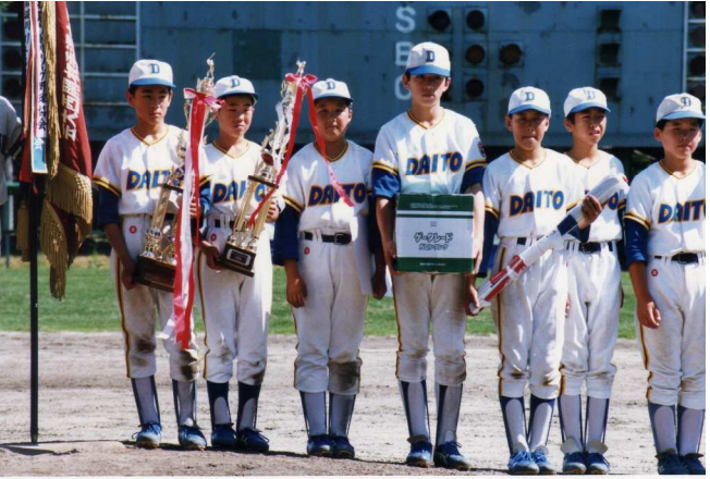
’91年度雪印杯リトルリーグ全日本選手権関西大会 1991.4.28～ 於 甲子園球場他